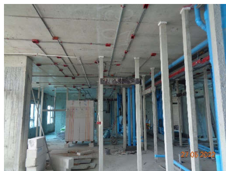
ภาพที่ 1.5-1 ความคืบหน้าของการก่อสร้างโครงการ